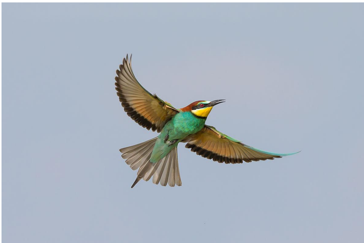
Abb. 1: Bienenfresser.